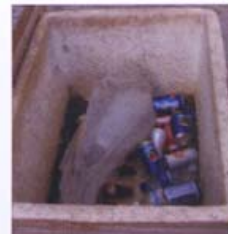
Produtos em isopor de camelo