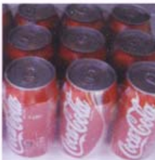
Latas em embalagens secundárias