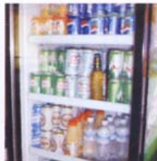
Embalagens de bebidas em refrigerador de ponto de venda